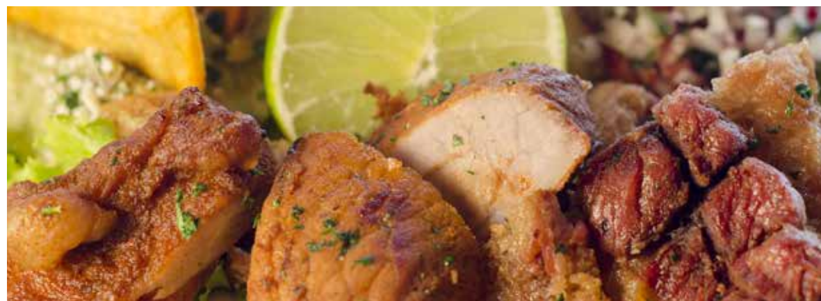
Chicharrón y Carnitas

Deliciosa combinación guatemalteca con risotto cremoso de carne adobada aromatizada con nuestra tradicional hierba de chipilín y queso provolone con perejil.