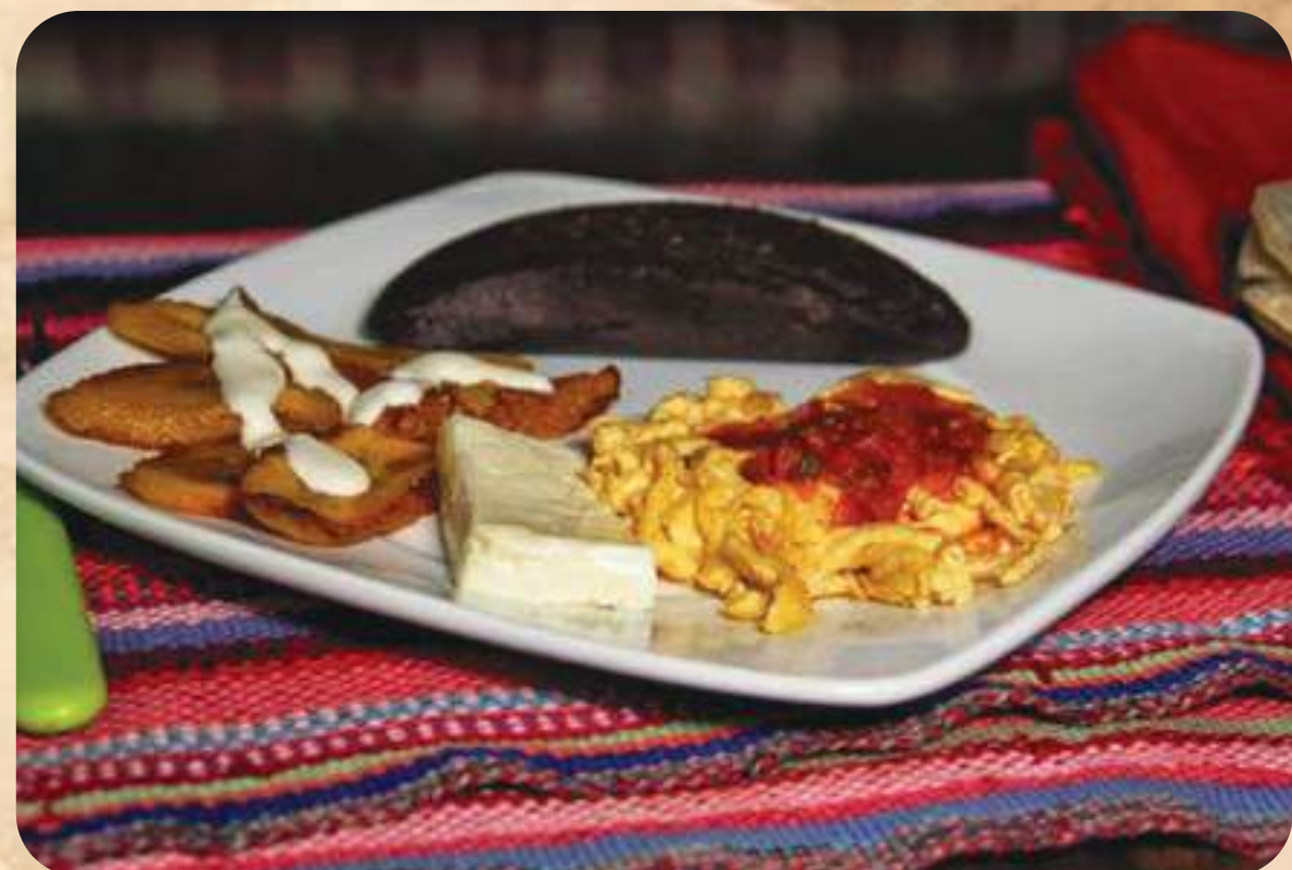
Desayuno Típico La Casona

Omellete de jamón, queso, tomate y cebolla con guarnición de frijol volteado, plátanos fritos, decorado con salsa roja, hilos de crema y cilantro, acompañado de pan de agua, jugo de naranja y café guatemalteco..... 45