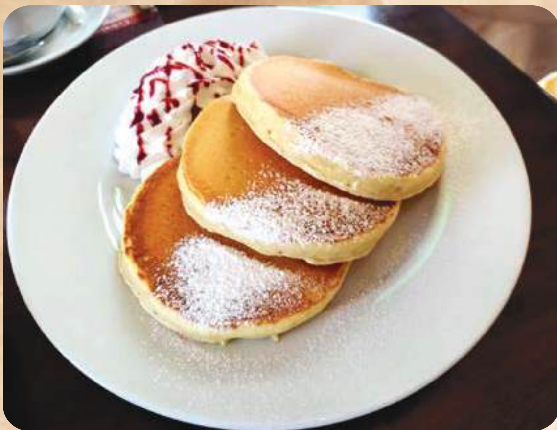
Panqueques "La Casona"

Tres panqueques tradicionales acompañados de crema batida y salsa de frutos rojos (mora y fresa ) con azúcar glass, miel de maple, (Solamente sábados , domingos y días festivos)..... 25