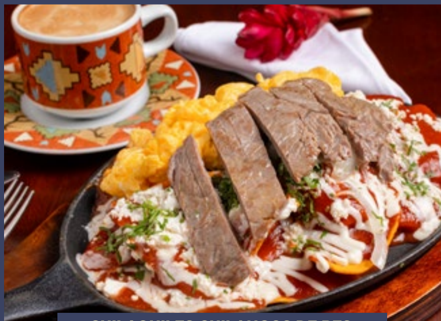
CHILAQUILES CHILANGOS DE RES

Medio pan telera, untado con frijol refrito y bañado con salsa roja, por encima 2 huevos revueltos y nuestro delicioso guiso de cochinita pibil. Decorado con hilos de crema, queso fresco espolvoreado y lascas de aguacate.